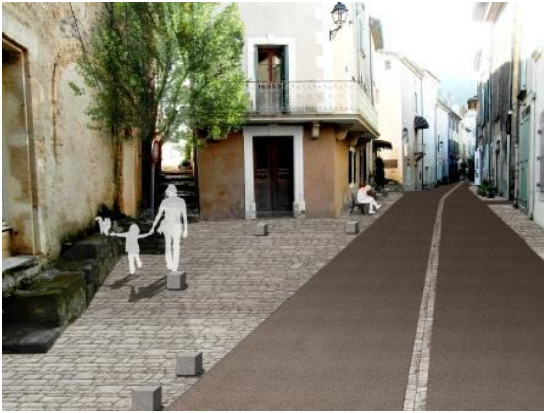
Rue Saint-Louis et rue de la Bourgade : la voie de roulement en enrobé est bordée de chaque côté par une calade en pied de façade.