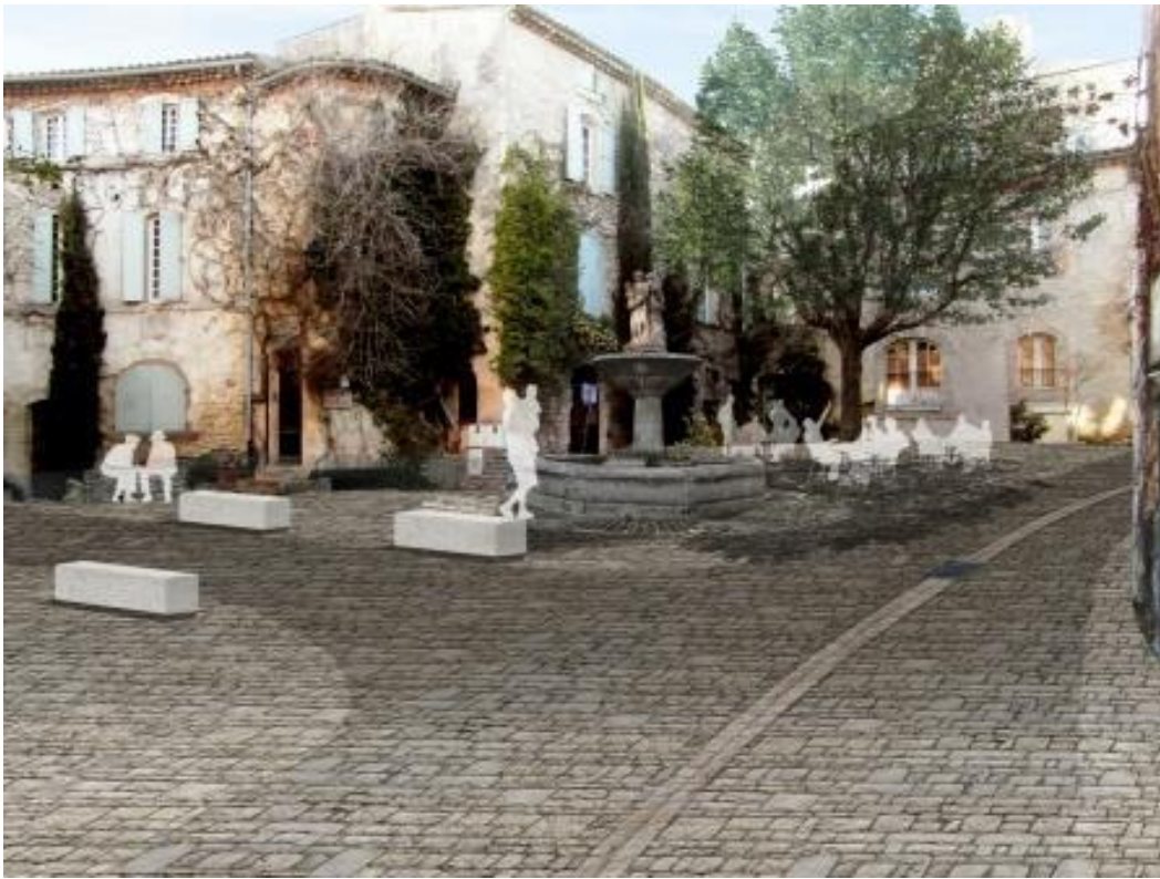
Place de la fontaine : la place est entièrement caladée. Le stationnement est interdit.